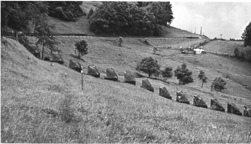
Situation der Letzi Beglingen