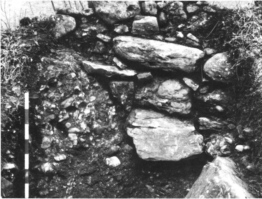
Letzi Arth/Sonnenberg. Sicht von Osten (Verteidigerseite) an die freigelegten Mauerfundamente. Auffällig ist, dass Bergsturzmaterial, z. B. der Nagelflubbrocken links, in die Konstruktion einbezogen worden ist.

Höhe und Bauart unbekannt ist die Brustwehr. Falls diese wie auf der Zeichnung von Schilling Zinnen aufwies, wird mit ungefähr 1,7 m zusätzlicher Mauerhöhe zu rechnen sein, so dass die Gesamthöhe bei etwa 3,9 m anzunehmen ist.